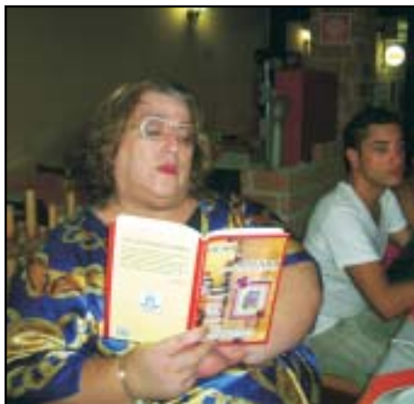
Mamma e o livro da Academia Peruibense de Letras