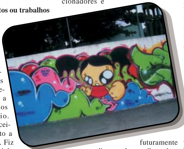
futuramente um livro totalmente ilustrado e

Sonhar nunca é demais, né? (risos) Acho que se eu vivesse daquilo que eu faço seria como um sonho, porque é difícil viver do que a gente gosta de fazer. Tenho alguns projetos para este ano, como ir para o ABC para pintar meus “tramos” por lá, pretendo fazer mais uma série de roupas, usando meus desenhos para minha própria marca, a “For Life” (comprem camisetas For Life (risos), pretendo lançar um livro de desenhos para colecionadores e