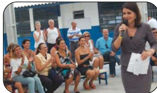
Inauguração da Quadra de Esportes na EMEF José Veneza Monteiro